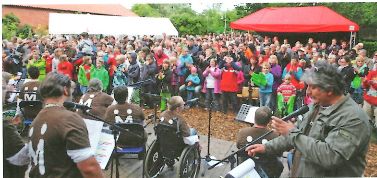
Gemeinsam feiern beim Summer Open Air der Stiftung Mensch in Meldorf